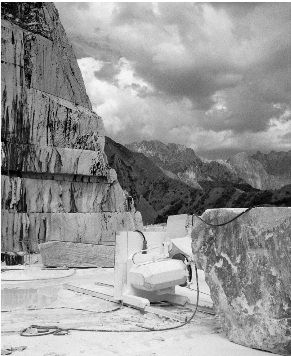
2 Steinbruch, Carrara, Italien

1 Paul Valéry, Genua aus: Windstriche - Aufzeichnungen und Aphorismen, 1929