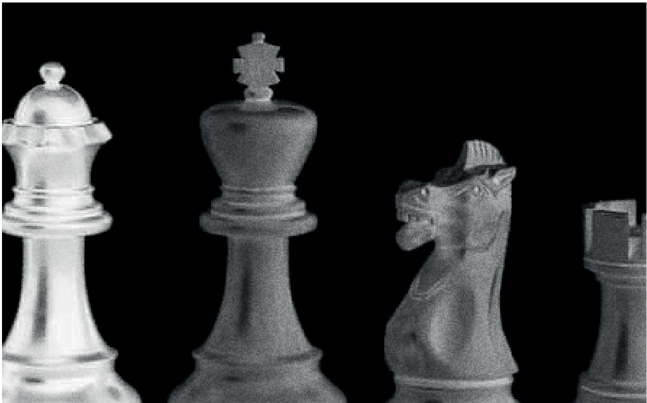
Abbildung 1 - Schachfiguren Staunton

Feldgröße: 5,7 auf 5,7 cm (im Maßstab 1:1*) d.h. 28,5cm auf 28,5cm im Maßstab 5:1