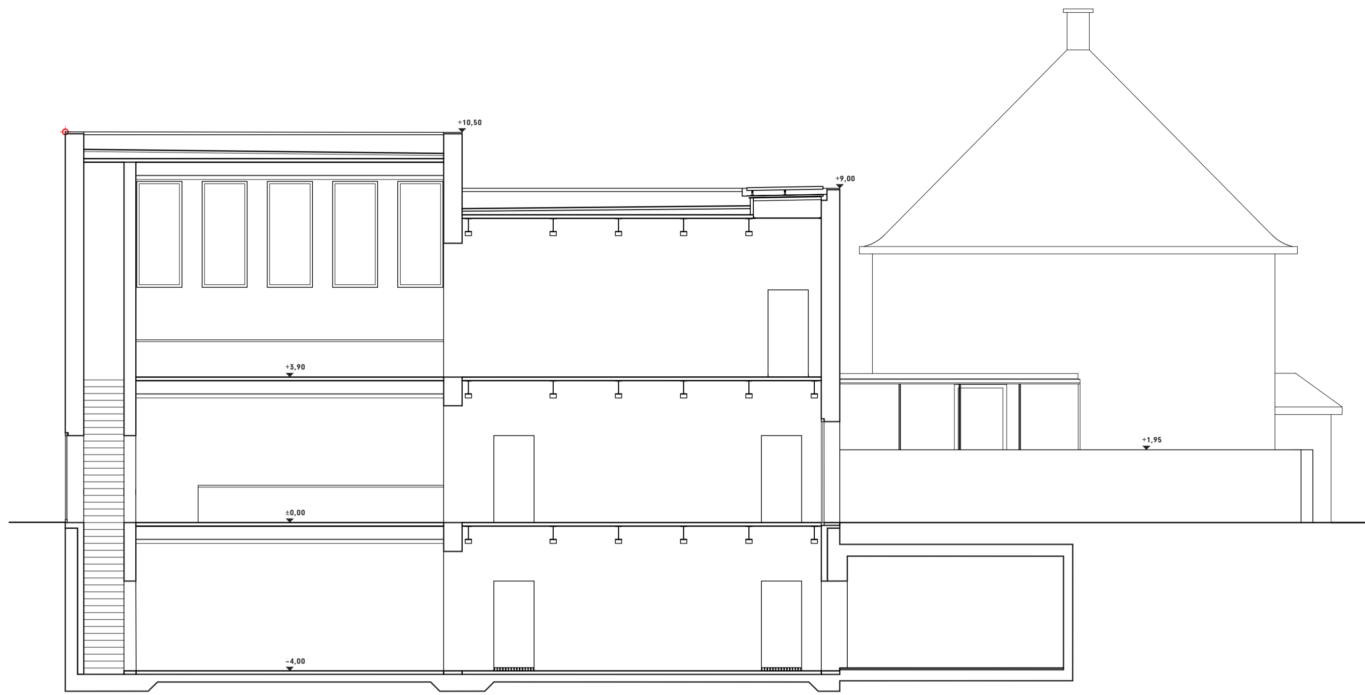
Schnitt A-A M1:100